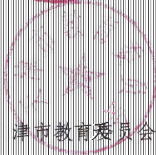
天津市教育委员会