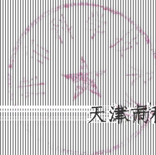
天津市科学技术局