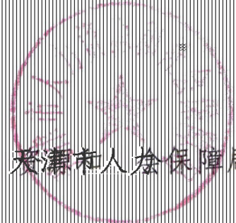
天津市人力资源和社会保障局